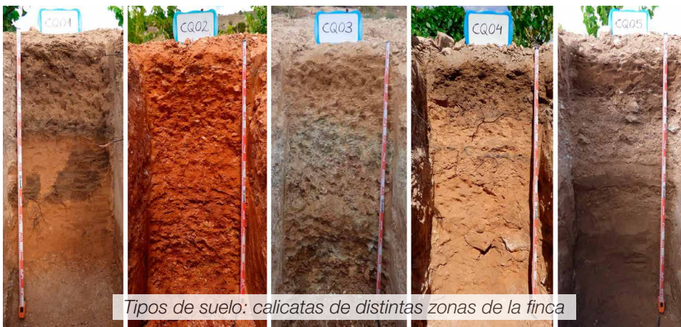
Tipos de suelo: calicatas de distintas zonas de la finca